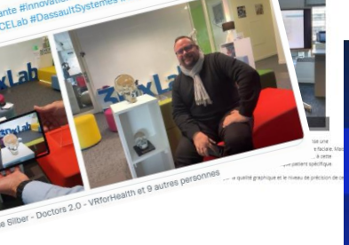
Reportage à découvrir sur @Buzesante : buzz-esante.fr/immersion-au-... #hcsmeufr #esante #innovation #innovationsante #santecomconnectee #3DEXPERIENCELab #DassaultSystems #3DExperienceCompany